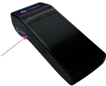
Kuva 1. Virtapainike.

Avaa kassasovellus ja kirjaudu PIN-koodilla . Saat PIN-koodin näkyviin pyyhkäisemällä sivulle yrityksen/tapahtuman nimen kohdalta.