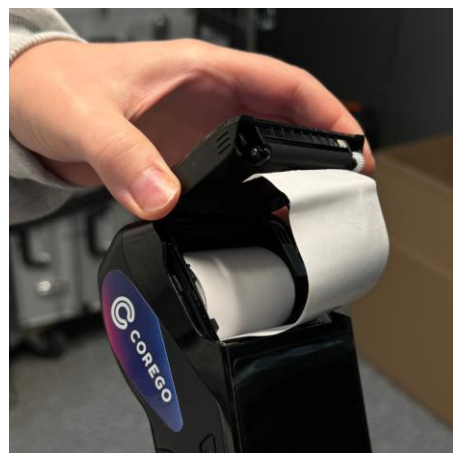
Kuva 4. Kuittirullan asetus oikein päin.