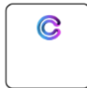
Kuva 2. CoreGo POS -sovellus päätteen näytöllä.

Jos kirjautuminen ei onnistu tai sovellus jää lataamaan pitkäksi aikaa, koita sulkea ja käynnistää kassasovellus/kassapääte/mobiiliverkkoyhteys uudestaan (ks. viimeiseltä sivulta kohta "Ongelmatilanteissa"). Jos kirjautuminen ei onnistu, ota yhteys CoreGon henkilökuntaan (yhteystiedot viimeisellä sivulla).